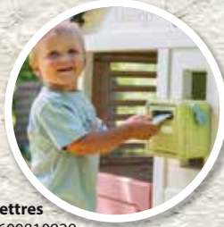
Boîte aux Lettres Réf. 7600810929