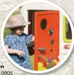
Porte Maison Réf. 810905