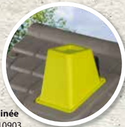
Cheminée Réf. 810903