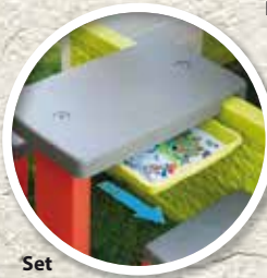
Set Tiroir Jeux Réf. 810913