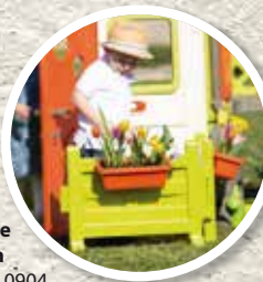
Espace Jardin Réf. 810904