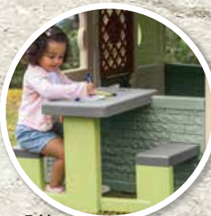
Table Pique-Nique ● Réf. 7600810927 ● Réf. 810920 ● Réf. 810902