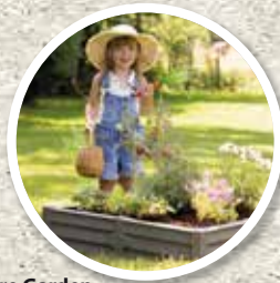
Bac Square Garden Réf. 7600850208