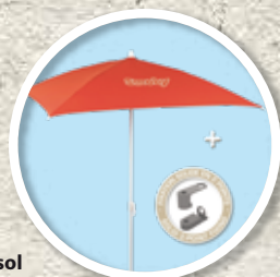
Parasol Réf. 7600810911