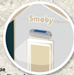
Lampe Solaire Nomade Réf. 7600810910