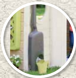
Récupérateur d'eau ● Réf. 7600810924 ● Réf. 7600810909