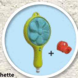
Douchette Réf. 7600810914